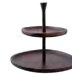
Serving stand 2-tier Alzata 2 piani Obstständer 2-stufig Présentoir 2 étages Frutero 2 niveles